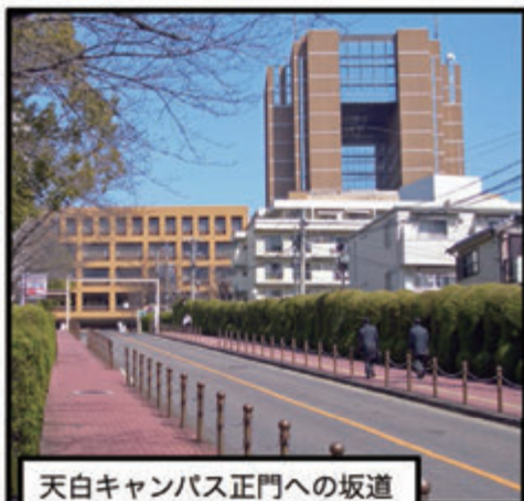
天白キャンパス正門への坂道

4月初旬、愛知県総合体育館において入学式が執り行われます。応援団によるエールも盛大です。