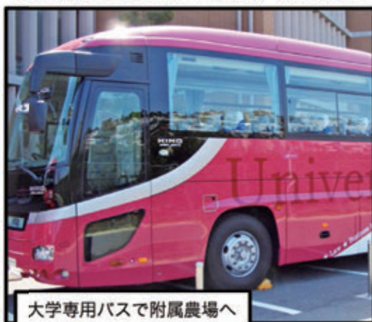
大学専用バスで附属農場へ

前期は4月初旬から7月中旬まで、後期は9月下旬から1月中旬までしっかりと行われ、その後は定期試験が待っています。