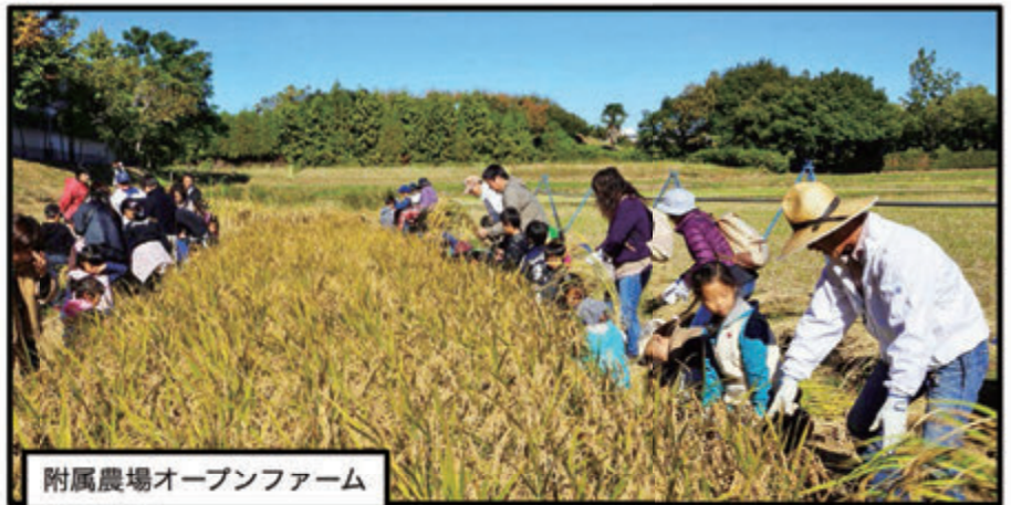
附属農場オープンファーム

附属農場での田植祭と収穫祭。卒業生、留学生、教職員も参加します。昼には例年豚汁が振るまわれます。